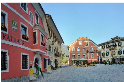
Marktplatz v. Oberdrauburg

Entdecken Sie unsere unberührte Natur, die Wälder und Auegebiete der Tallagen, die vielen Wildbäche und Wasserfälle sowie die schroffen Gipfel der Lienzner Dolomiten. Zahlreiche bewirtschaftete Hütten laden zum Verweilen ein. Wer so weit oben in den Bergen ist, hat immer ein großes Stück Himmel für sich alleine.